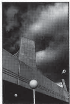
4° di copertina: Maurizio Zen «The sentinelle»