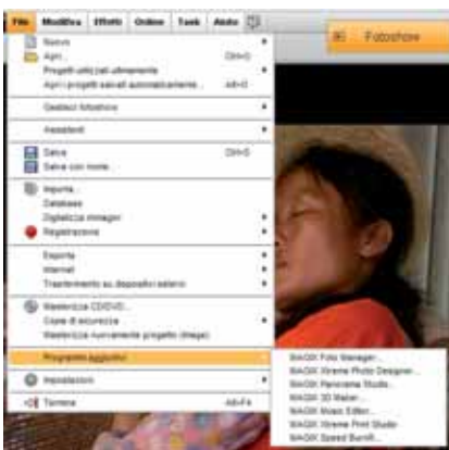
Figura 3 - Il menu File. La voce evidenziata mostra quali e quanti sono i programmi richiamati dal modulo principale.

visualizzato il montaggio, alla sua destra c'è l'elenco delle foto importate, in basso la timeline con le quattro tracce disponibili, ossia le foto, il parlato, i testi e la musica; la sua forma d'onda è visibile e risulta abbastanza facile effettuare buone sincronizzazioni suono-immagini. Invece della timeline si può attivare il