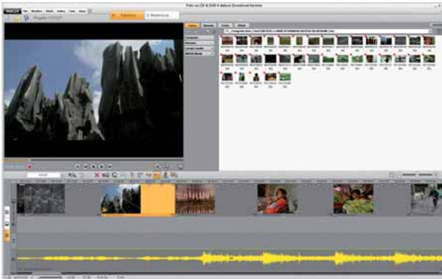
Figura 2 - Così appare Foto su CD e DVD in versione timeline. In giallo la foto selezionata, visibile in alto.