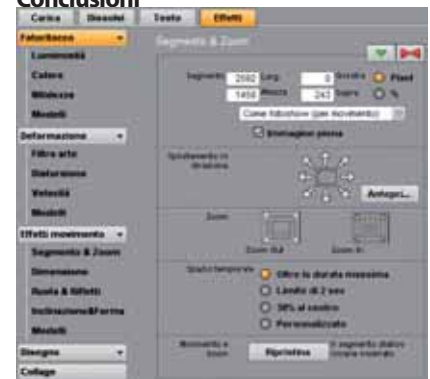
Figura 5 - Esempio di personalizzazione degli Effetti. Le possibilità di intervento sono numerosissime.

L'uscita del fotoshow è un filmato, da vedere direttamente al PC o da masterizzare in vari formati, dal normale DVD all'alta definizione; manca invece l'EXE. Dalla semplice proiezione automatica, molto facile, si può arrivare a lavori più complessi, che richiedono un notevole impegno. Un limite penalizzante sta nelle rotazioni, zoomate e panoramiche, che purtroppo sono solo automatiche. Il programma è potente e duttile, a patto di conoscerlo bene: il tempo di apprendimento non è trascurabile! C'è una sola pista per ogni funzione: questo è il limite più vistoso e vincolante: un vero peccato, perché se Magix mettesse due o tre piste video e audio sarebbe tutta un'altra cosa. Ad ogni modo, rispetto ai programmi già esaminati abbiamo fatto importanti progressi. Il costo è di 60 Euro in versione Deluxe e 30 in quella normale.