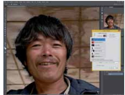
Figura 5 - In Migliora bordo si può scegliere tra sei visualizzazioni diverse, oltre all'originale. In alto (blu) c'è Cornice tratteggiata , che evidenzia la selezione effettuata.