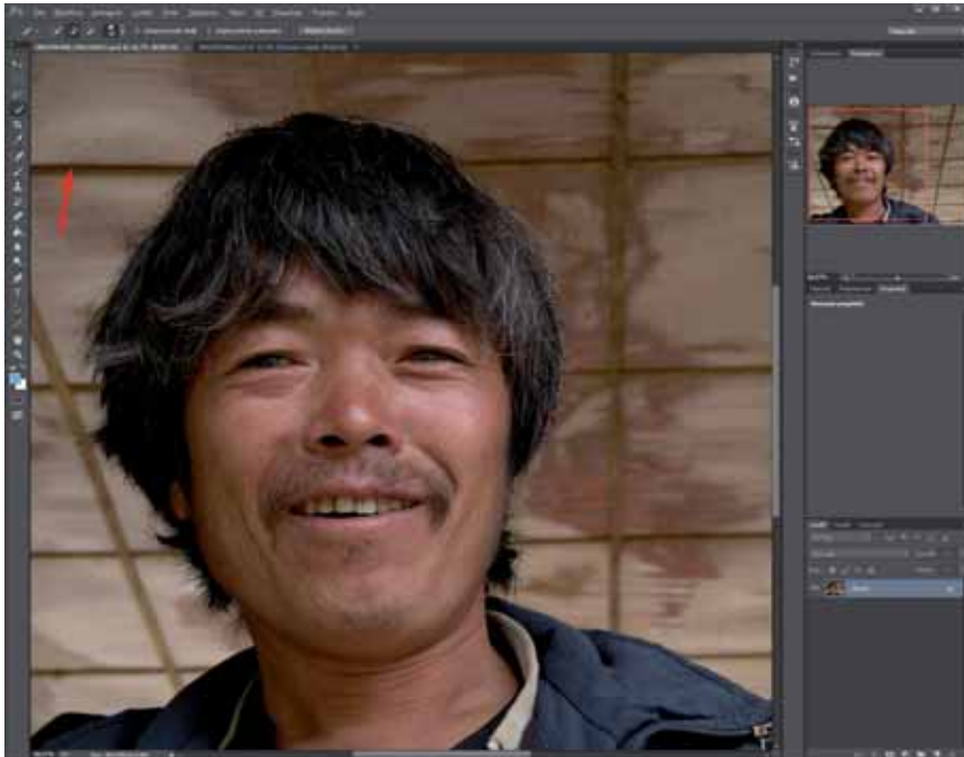
Figura 3 - Continuando ad allargare la selezione, può capitare che essa si estenda troppo (tratteggio sopra la freccia) fino ad arrivare al bordo sinistro.