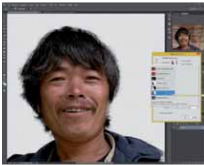
Figura 8 - La vista Su trasparenza è un'altra alternativa. Ciascuna ha la sua utilità e va attivata alla bisogna per verificare se si è fatto un buon lavoro: questo non è molto lungo e, dopo un po' di prove, neppure troppo complicato. Ma preciso sì.