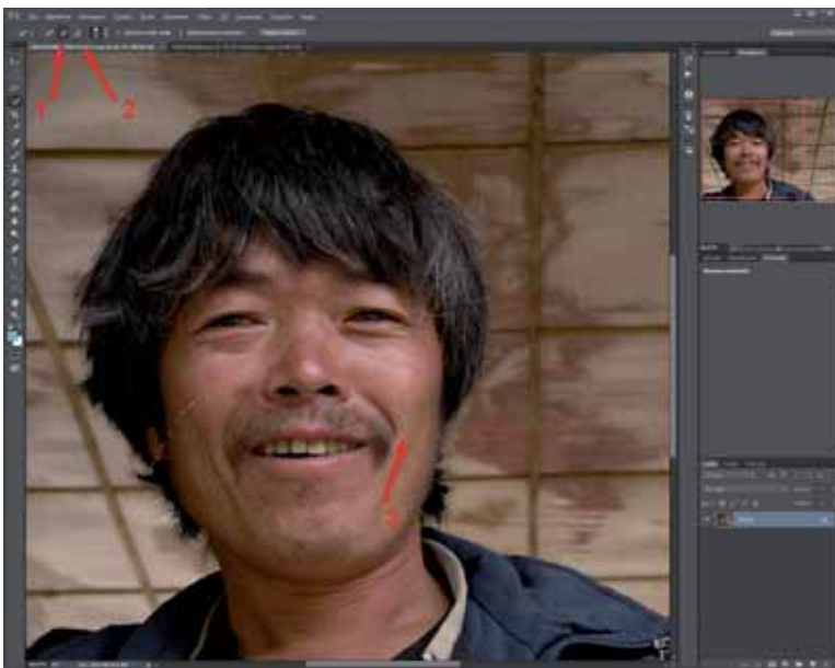
Figura 2 - Questo è lo strumento Selezione rapida . Prima di partire si attiva Aggiungi alla selezione (freccia 1); a destra c'è Sottrai dalla selezione (freccia 2). Il primo mostra un cursore circolare col segno + al centro, il secondo col segno -. La freccia 3 indica il margine alto della selezione, in una posizione intermedia ottenuta partendo dal basso per selezionare tutta la persona. Lasciando il pulsante del mouse la selezione resta attiva; continuando a trascinare col + partendo da dove si era arrivati, si ha l'estensione della selezione.