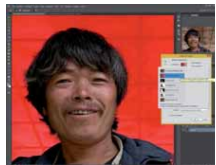
Figura 6 - Con Sovrapposizione si ha la maschera veloce.