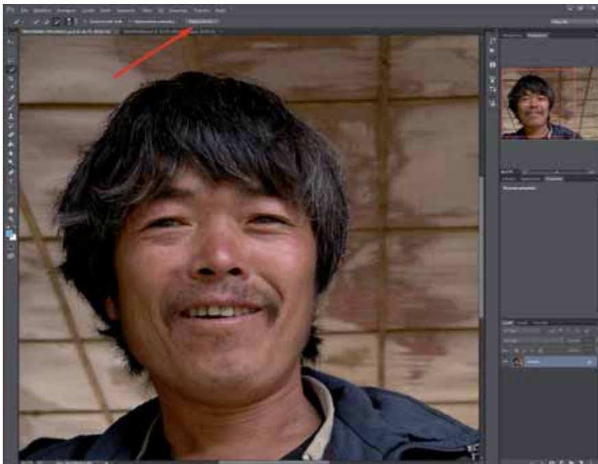
Figura 4 - Usando Sottrai dalla selezione sull'area a sinistra, si arriva immediatamente alla selezione giusta. Se si fa un errore, si può annullare con Ctrl+Z . Usando alternativamente Aggiungi e Sottrai si rifinisce attorno al capo, con la selezione sul confine capelli-sfondo. Diminuendo la larghezza del pennello si aumenta la precisione. Non bisogna andare troppo all'interno, perché ciò che faremo più avanti tende facilmente a erodere, rendendo trasparenti zone che non devono esserlo. Al termine si clicca sul pulsante Migliora bordo (freccia).