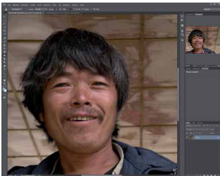
Figura 1 - Figura di partenza, da scontornare per inserirla su uno sfondo diverso

È bene chiarire che l'effetto di questo strumento varia molto col tipo di foto da trattare. Se abbiamo una modella in studio, con luci e sfondi omogenei, tutto fila via liscio e facile. L'esempio che ho scelto è invece ben più impegnativo, nel senso che quando ci sono sfondi complicati, oltre a capelli molto fini e separati, ci si deve accontentare maggiormente. Ho dovuto correggere con la gomma alcune lievi scie scure provocate dal soffitto a riquadri, anche a ridosso dei capelli e delle spalle; abbastanza facile, comunque. Dopo un po' di pratica, si è trattato di un tempo di elaborazione molto contenuto, attorno ai dieci minuti. È stato divertente!