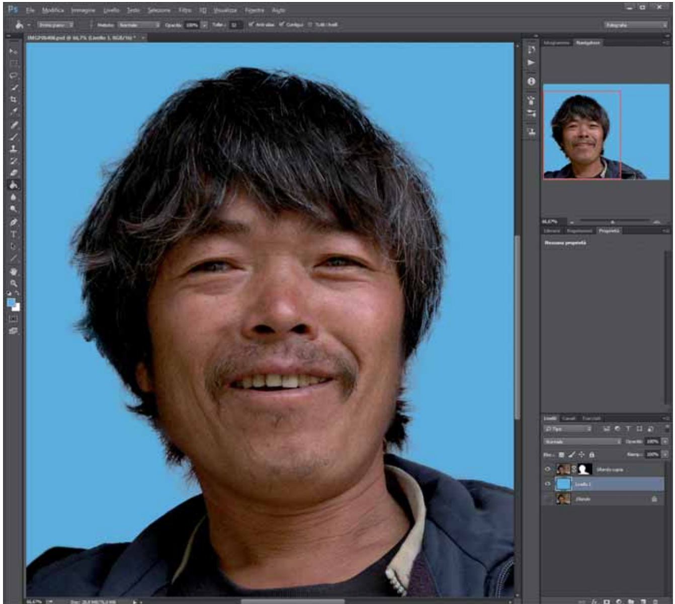
Figura 10 - Questo è il risultato finale, abbastanza gradevole se si pensa che la foto non era davvero adatta a dare più di tanto. Ho aggiunto uno sfondo azzurro per evidenziare l'effetto del trattamento. Con uno sfondo reale più variegato ci si può dichiarare soddisfatti. Si noti che la foto di partenza non è stata toccata; l'effetto è stato ottenuto con un solo livello aggiuntivo.