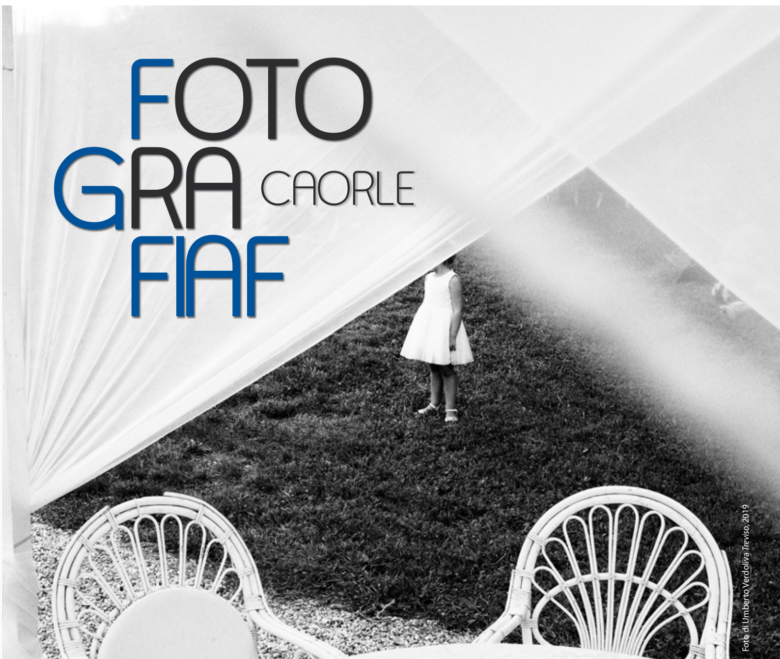
Treviso, 2019